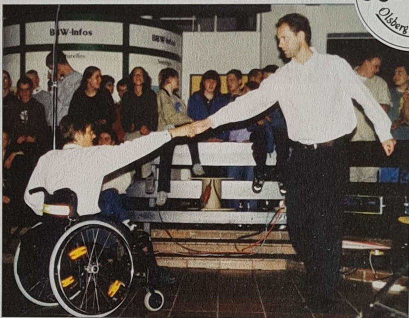
Ein Rollstuhl-Tanzpaar des TSC Olsberg in Aktion.